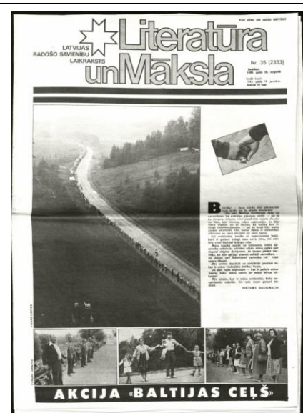
Literatūra un Māksla Nr. 35. 26.08.1989.

Jānis Peters par tautas pašnoteikšanos, "perestroiku" un par sevi. Laiks Nr. 74. 14.09.1988.